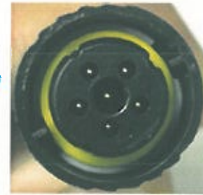
Figura 2: vista frontal de los conectores de la fuente de alimentación

Intentar limpiar el interior del conector de la fuente de alimentación puede provocar daños en los componentes del sistema HeartWare HVAD, lo que puede afectar al rendimiento del controlador y de la bomba. Los posibles problemas de rendimiento derivados de dañar los conectores de la fuente de alimentación van desde daños insignificantes hasta una parada inesperada del VAD.