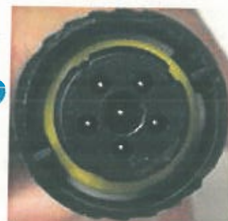
Figura 2: vista frontal de los conectores de la fuente de alimentación

A continuación, encontrará un resumen de los cambios efectuados en las instrucciones de limpieza del adaptador de CA, el adaptador de CC y la batería del controlador.