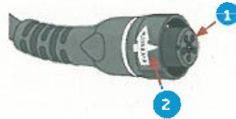
Figura 1: vista lateral de los conectores de la fuente de alimentación