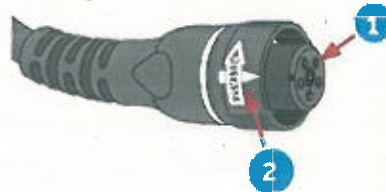
Figura 1: vista lateral de los conectores de la fuente de alimentación