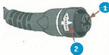
Figura 1: vista lateral de los conectores de la fuente de alimentación